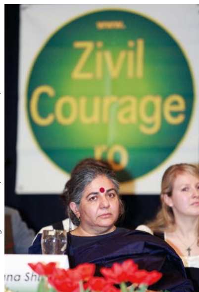
„Wer soll in Zukunft unsere Lebensmittel erzeugen?“ Vandana Shiva 2009 bei einer Veranstaltung der „Zivilcourage“ – einer Arbeitsgemeinschaft von unabhängigen Bauern und Bürgern gegen die Agro-Geotechnik.

Was wir messen sollten, ist viel umfassender: Wie viele Menschen haben Arbeit mit einer fairen Entlohnung?